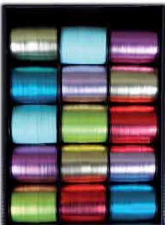
U MÉTAL MAT 201561 COULEURS ASSORTIES