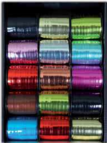
U MÉTAL 201517 COULEURS ASSORTIES