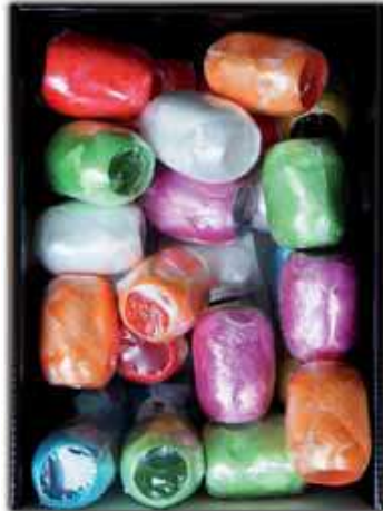
R LISSES 201512 COULEURS ASSORTIES