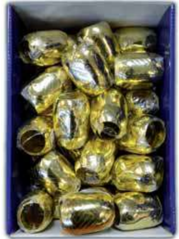
P MÉTAL OR 201518B