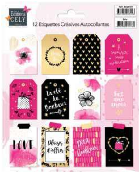
303101 TIMBRAGE OR