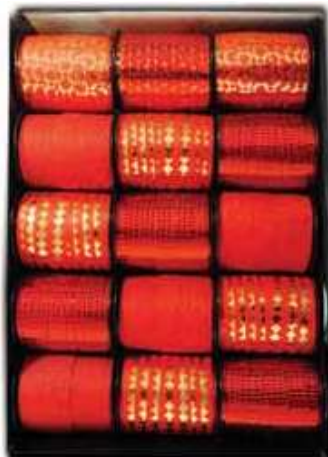
O 2015103 ROUGE