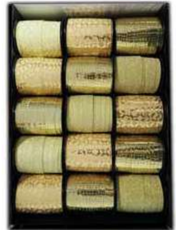
O 2015100 OR