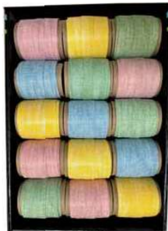
0 3 397220 221733 201511 PASTEL