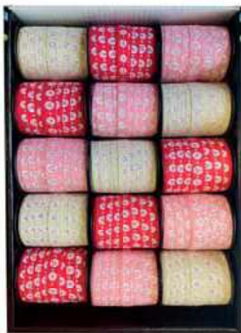
0 3 397220 242554 2015150 COEUR