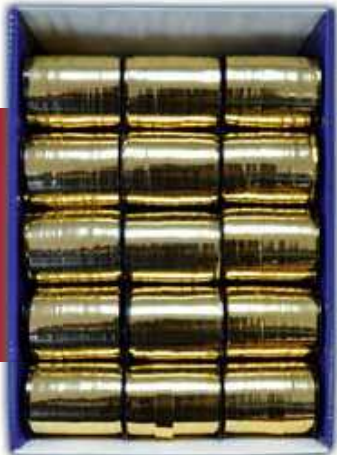
U 201518 MÉTAL OR