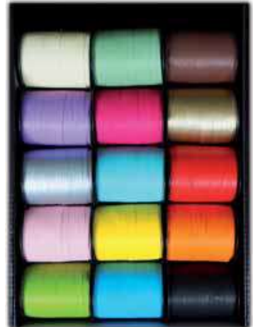
U MAT 201508 COULEURS ASSORTIES