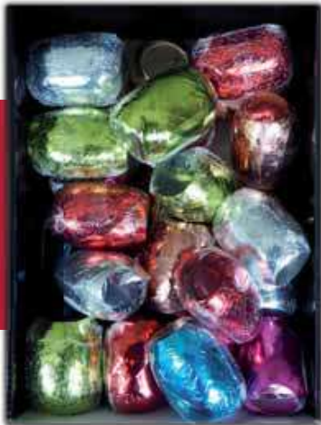
P MÉTAL 201517B COULEURS ASSORTIES