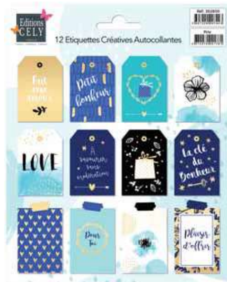
303102 TIMBRAGE OR