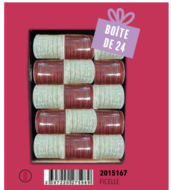
0 3 397220 275989 2015167 FICELLE